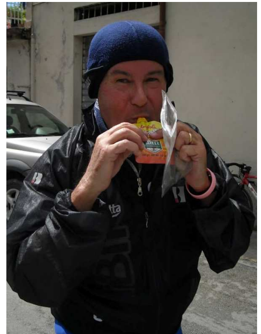
Sosta dissetante dopo le fatiche per Scatteia

Timeo Danaos et dona ferentes! (temo i Greci che portano doni!),(Il vate Tiresia ai Troiani , cercando inutilmente di dissuaderli dall'accettare il dono del cavallo di legno di Ulisse);ogni riferimento alla realtà ,anche politica ,italiana è puramente casuale;