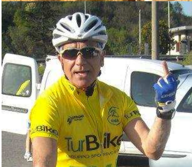
Sorgiulio indica agli avversari l'esito della 24h...

Due parole per i restanti Team, Aquile e Giaguari: me dispiace che avete scaiato..succede... :-)